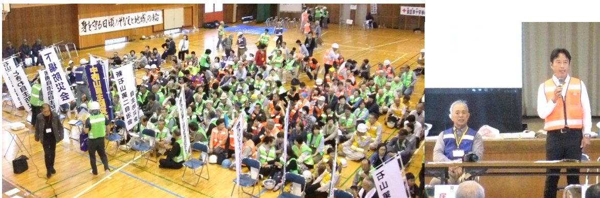
★参加者 385 名 (うち役員スタッフ 45 名)

毎年行われている中野山コミ協「防災訓練」では、「実際に災害が発生した時に対応できるように、日頃から訓練し、適切な行動ができるようにしましょう」と防火防災部会が中心となって開催されています。