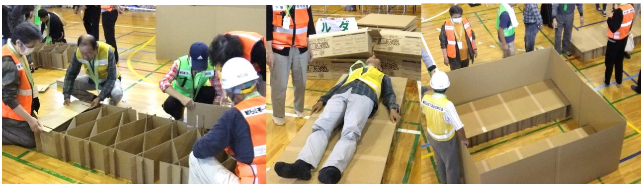
★段ボールベット作りと段ボール間仕切り体験