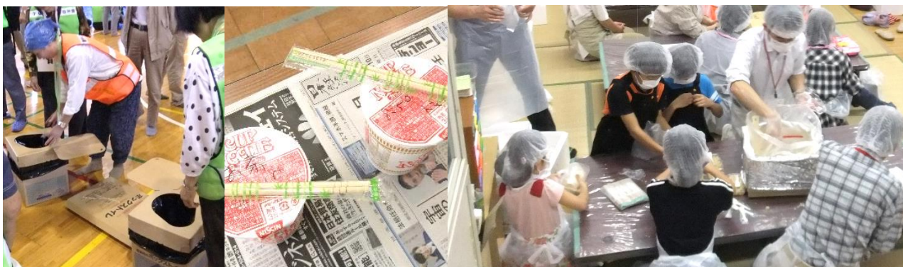
★簡易トイレ組み立て